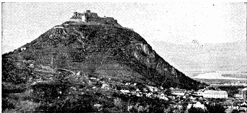
Orașul și cetatea Deva în timpul de față.