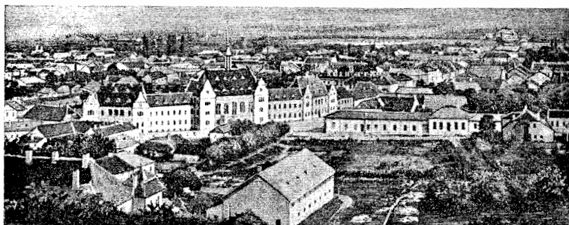
Vederea generală a oraşului Deva în ziua de azi.