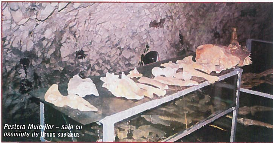
Peștera Muierilor - sala cu oseminte de Ursus spelaeus

Plecăm de la cabana „Peștera Muierii”, de unde urcăm câțiva zeci de metri până la intrarea în peșteră. După ce trecem de poarta metalică de la intrare, unde arcada peșterii are o înălțime de 3 m, pătrundem într-o galerie cu înălțimea de 1,5-2,0 m, cu concrețiunii afumate. După parcurgerea a circa 40 m, apar primele formațiuni stalagmitice, cele mai interesante fiind Orga, Domul Mic și Bazinul Mic. Ne continuăm drumul spre „Sala Altarului”, unde o așezare de coloane cunoscute sub numele de „Altar” se impune ca imagine, iar alături se deschide o cupolă, înaltă de peste 20 m - „Hornul”. O pelliculă sângerie de limonit îmbracă un bloc de calcar, este „Piatra sângerată”. Străbatem o galerie de legătură, lungă de circa 120 m, la mijlocul căreia este amenajată, într-o mică săliță, o vitrină unde sunt expuse oseminte de Ursus