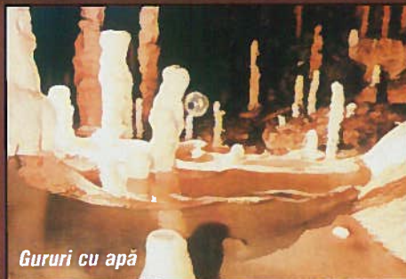
Gururi cu apă

Datorită formațiunilor spectaculoase ce îmbracă forme mai puțin obișnuite, de un farmec deosebit, această gale-