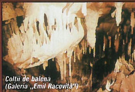
Colții de balenă (Galeria „Emil Racoviță”)

După ce parcurgem circa 150 de metri, pătrundem într-un sector larg al Galeriei Oaselor - o sală unde bolta se ridică până la aproape 20 de metri înălțime și care poartă numele „La Intersecție”. De aici se desprind două galerii, dintre care una ne îndrumă