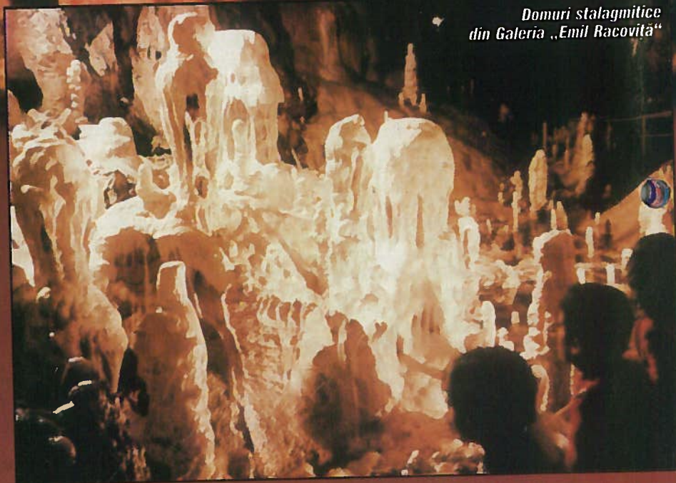
Domuri stalagmitice din Galeria „Emil Racoviță”

P e flancul vestic al Munților Bihor, în satul Chișcău, pe versantul stâng al Văii Crăiasa (afluent al Crișului Negru), la o altitudine de aproximativ 480 m, se deschide gura uneia dintre cele mai cunoscute peșteri din România, Peștera Urșilor. Pe pîntenul nordic al Dealului Măgurii, situat între Valea Peșterii, la vest, și Valea Brusturilor, la est, înainte de amenajarea peșterii exista o carieră de calcar marmurean. În anul 1975, în urma lucrărilor de exploatare, a fost făcută o deschidere a unui gol subteran, cu o lungime a galeriilor de peste 1500 m, dispuse pe două niveluri. În același an, după o primă explorare a cavității de către un grup de speologi amatori din orașul Ștei, se ia hotărârea ca această peșteră, numită Peștera Urșilor, datorită scheletelor de urs de peșteră ( Ursus spelaeus ) găsite, să fie amenajată pentru vizitare. Aici se poate ajunge părăsind șoseaua națională (DN 76), ce leagă Deva de Oradea, în dreptul localității Sudrigiu, la 70 km de Oradea și la 10 km de Ștei, și îndreptându-ne, cale de 14 km, spre satul Chișcău. În anul 1980, sub îndrumările directe ale Institutului de Speologie „Emil Racoviță”, în colaborare cu Muzeul Țării Crișurilor din Oradea, Peștera Urșilor