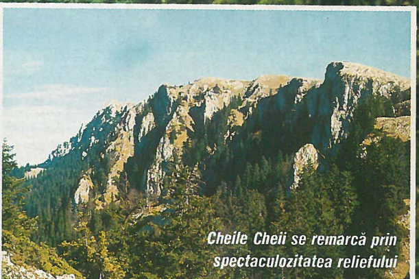
Cheile Cheii se remarcă prin spectaculozitatea reliefului