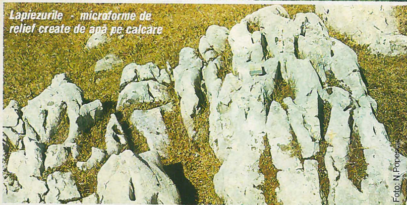
Lapiezurile - microforme de relief create de apă pe calcare