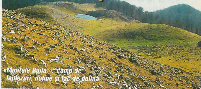
Muntele Buila - câmp de lapiezuri, doline și lac de dolina