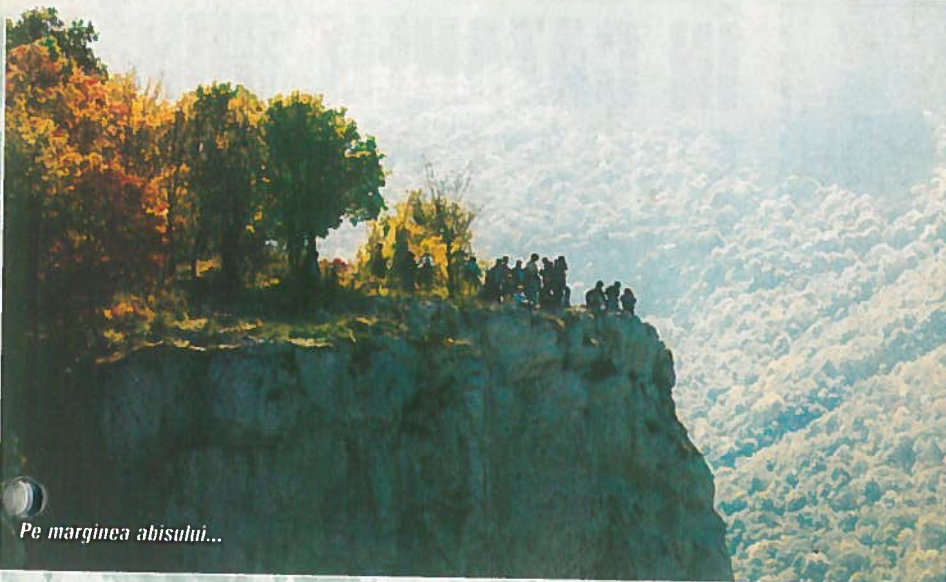
Pe marginea abisului...

insule, ce constituie resturi din vechiul ostrov omonim, care, în urma construirii hidrocentralei „Porțile de Fier” și a lacului de acumulare, a fost în mare măsură inundat. Aici Dunărea are cea mai mare lățime din defileu, de peste 5 km. Imediat ce depășim localitatea Coronini (Pescari), cele două maluri ale fluviului se apropie foarte mult, Dunărea săpându-și albia în calcare mezozoice. Pereții trec de 100 m înălțime, iar lățimea albiei nu depășește 500 m.