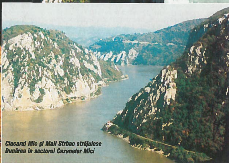
Ciucarul Mic și Mali Strbac străjulesc Dunărea în sectorul Cazanelor Mici

Al doilea fluviu al Europei ca dimensiuni, după Volga, Dunărea își are izvoarele pe teritoriul Germaniei, în Munții Pădurea Neagră. În drumul său spre vărsare, acesta străbate Europa de la vest la est pe o lungime de 2860 km, adunându-și apele de pe o suprafață de 805.300 km pătrați.