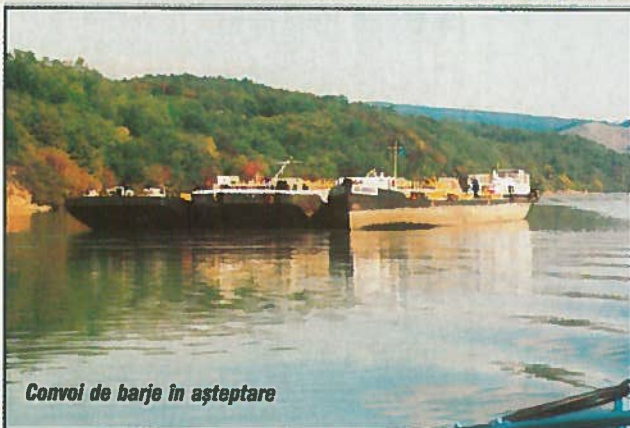
Convoi de barje în așteptare