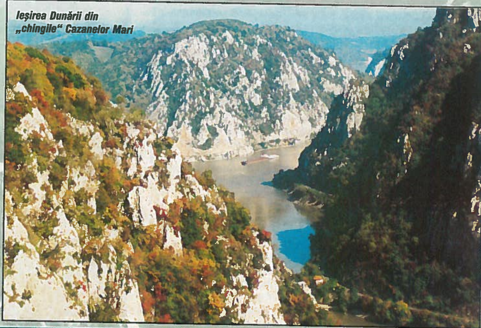
Ieșirea Dunării din „chिंगile” Cazanelor Mari

Dincolo de Cazanele Mari, apele fluviului pătrund în micul bazinet Dubova, ce are forma unui golf cu aspect semicircular. În aval de Dubova, Dunărea pătrunde în Cazanele Mici, formate din Ciucaru Mic (313 m), pe stânga, și Mali Strbac (626 m), pe dreapta, masive calcaroase de vârstă mezozoică. În acest sector, cu o lungime de circa 3,6 km, albia atinge cea mai mică lățime