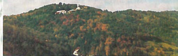
Orșova - Mănăstirea Sf. Ana

Defileul „Porțile de Fier” este caracterizat de o alternanță a sectoarelor de bazine depresionare cu sectoare înguste, diferențiate morfologic și structural. Formele de relief din sectorul de defileu prezintă o bogăție și varietate ieșite din comun. Relieful carstic evidențiază forme de suprafață variate: chei, doline, uvale, lapiezuri, larg răspândite, îndeosebi în platourile carstice Ciucarul Mare, Ciucarul Mic și Sfânta Elena, precum și în văile afluenți Dunării - Berzasca, Mudăvița Seacă ș.a. Carstul de adâncime este prezent prin numeroase peșteri și avene, dintre care se detașează peșterile Gaura cu Muscă, Valea Polevii, Gaura Chindiei II etc. Plecând din Moldova Veche, din apele Dunării răsar câteva